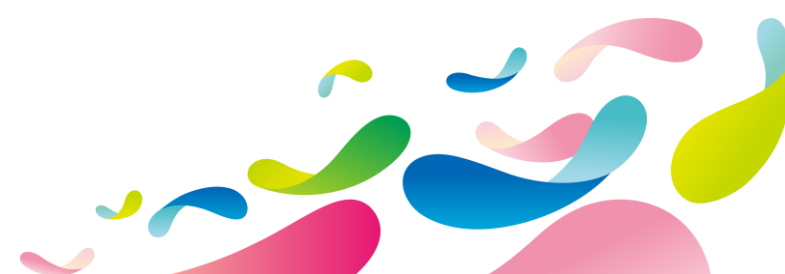
サブグラフィック